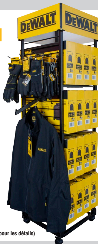
DHG-DISP-16 (voir le représentant commercial pour les détails)