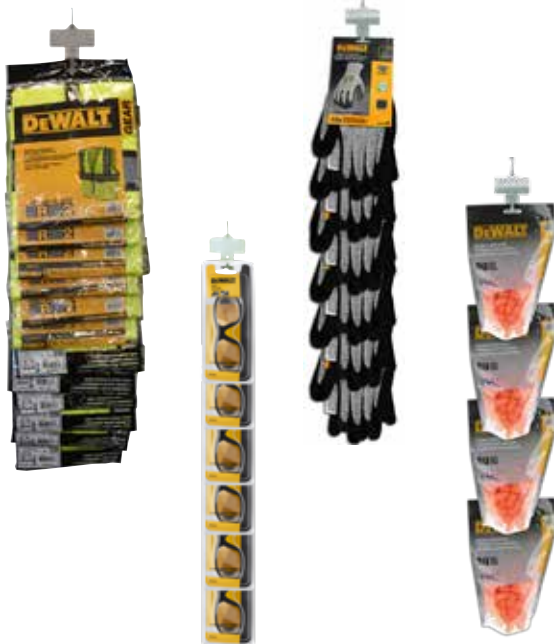
9066 Tira de ganchos (Producto no incluido)