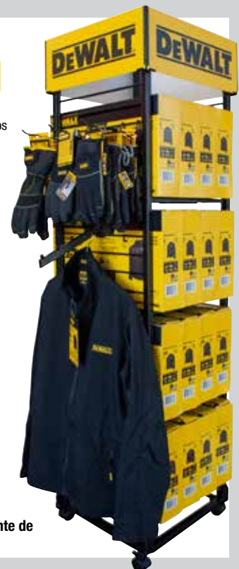
DHG-DISP-16 (Comuníquese con el representante de ventas para detalles adicionales)